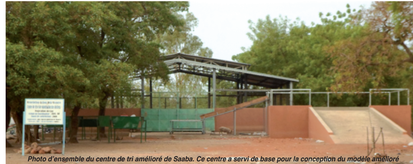
Photo d'ensemble du centre de tri amélioré de Saaba. Ce centre a servi de base pour la conception du modèle amélioré

Déchets ménagers, nettoyage issue des marchés et espaces publics, déchets vert