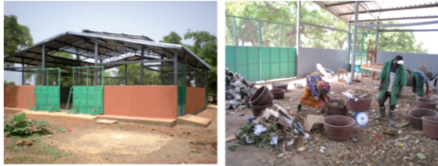
Photo centre de tri : les opérations de tri sont manuelles et fastidieuses

Un centre de tri est une installation dans laquelle les différentes fractions des déchets collectés sont séparées en vue de leur traitement/valorisation. On entend par tri toute opération visant à séparer les unes des autres les catégories, voire les sous-catégories de matériaux contenus dans les déchets (verre, papier, carton, plastiques, terre, etc.)